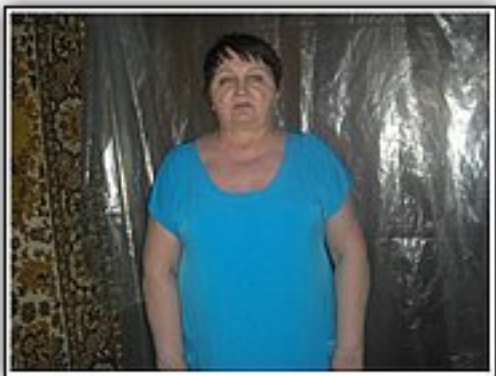
«Успех. Новые психологические технологии» Центр психологической коррекции веса