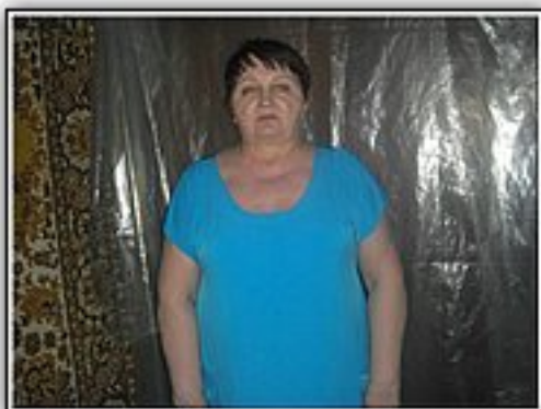
«Успех. Новые психологические технологии» Центр психологической коррекции веса